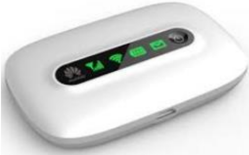
De Mifi van Huawei

zover mij bekend Droom en Wereldwijd WI-FI. In de Mifi zit een batterij, dus tijdens het auto rijden heb je gewoon ontvangst. Heb je voldoende GB voor je abonnement, dan kun je op je telefoon een hotspot aan maken. Let er wel op dat even TV kijken veel van je bundel gebruikt.